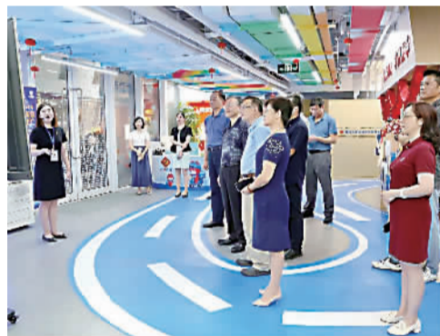
实地考察近铁楼委会(组图)