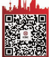
欢迎关注工商银行上海市分行官方微信平台

务中,工行已经成功落地跨区域公共交通、特色联动商圈、跨区域公共支付等场景。如工行上海分行积极与上海公共交通公司在自助充值机和乘车码方面开展数字人民币的试点应用,一方面在长三市示范区青浦段17号线所有地铁站内可在交通卡自助充值机上通过“数字人民币app”中的扫码支付为上海交通卡进行充值,另一方面通过“上海交通卡app”中乘车码绑定工行数字人民币钱包可进行车费免密支付,为市民提供“先乘车、后付款”的便捷出行体验。目前工行长三市示范区试点,在工行的支持下,青浦地区已有90余户数字人民币商户,未来将有四个试点完成了数字人民币支付受理改造。