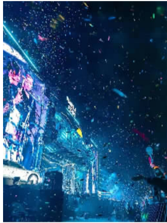
趣的节日盛事与赛事活动。(森兰 Sunland)