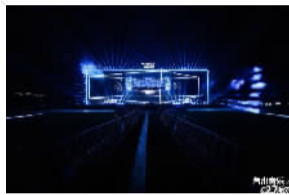
创新消费的更多可能。森兰区域后续还将持续举办更多充满激情与乐趣的节日盛事与赛事活动。