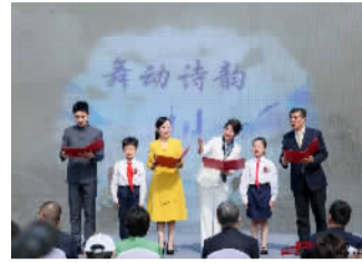
涵、趣味互动等多个维度共同塑造牡丹文化全新形态。浦东牡丹园分会场同步举办系列活动,以传统艺术对话数字创新,展现文化传承的多元维度。(浦东发布)

读书节当天,正值浦东森兰牡丹园举办期间,浦东牡丹园内总计有43个品种、12大色系的牡丹花陆续绽放。在视觉享受之外,书香上海流动书房、大师讲堂、春色游园打卡、非遗手作等精彩活动目不暇接,秘境怒江·咖啡火腿美食节同期进行中,从潮流风尚、文化内