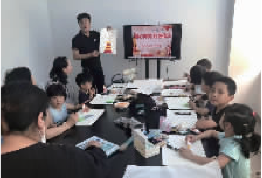
党员为小朋友讲党史故事

2021 年,为了解决社区电动自行车充电难、老年人上下楼梯不便等问题,场中路 2401 弄居民区在条件有限的情况下,仍然迎难而上,大力推进电动自行车充电桩以及加装电梯等民生工程,提升居民家门口的安全感和幸福感。