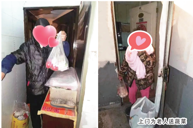
上门为老人送蔬菜