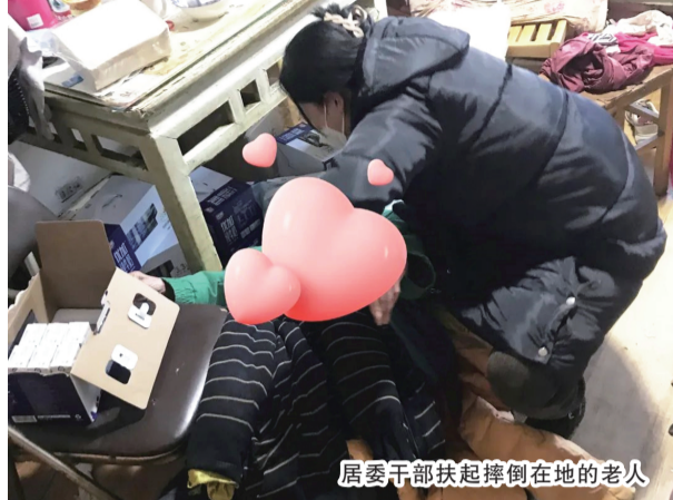
居委干部扶起摔倒在地老人

特殊时期,凝心聚力的分量尤重。当前,随着防控措施不断优化调整,疫情防控进入新阶段,迎来了新挑战。在此关键时刻,有这么一群人,舍小家顾大家,以高度的责任感和使命感奋战在第一线,一项项关心关爱的举措,一个个雪中送炭的身影,凝聚起寒冬里最温暖的力量,簇簇微光勾勒出他们最美丽的模样。