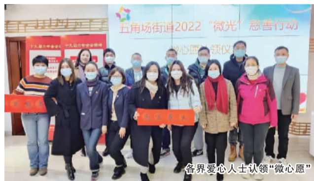
各界爱心人士认领“微心愿”

今年初,五角场街道启动了2022“微光”慈善行动微心愿认领活动,希望通过微心愿认领、志愿行动,让更多有责任心的党组织、爱心企业和爱心人士参与进来,和社区一道“安老、扶幼、助学、济困”,在党建引领下将慈善公益引向深入。爱心企业和爱心人士亲手将捐赠物品交予心愿认领人手中,用“微光”为他们带去希望和温暖。