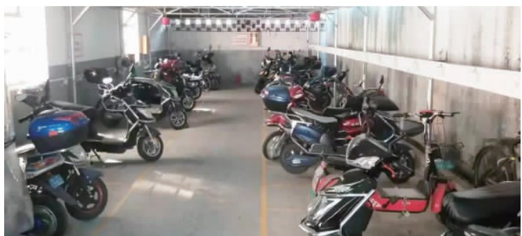
改造后的智能非机动车棚

傍晚时分,居民骑着电动车回到小区,在车棚外刷IC门禁卡后,将车停到规定区域,摄像头实时监控,感应灭火器24小时待命,有力保障了群众安居和社区安定。另一方面,“心安”社区志愿者消防队通过软件建设,为社区平安保驾护航,有力推进了社区消防安全宣传、消防隐患排查,有效遏制了楼道堆物、飞线充电等社区管理顽疾,探索出了一条社区平安自治的新路子。