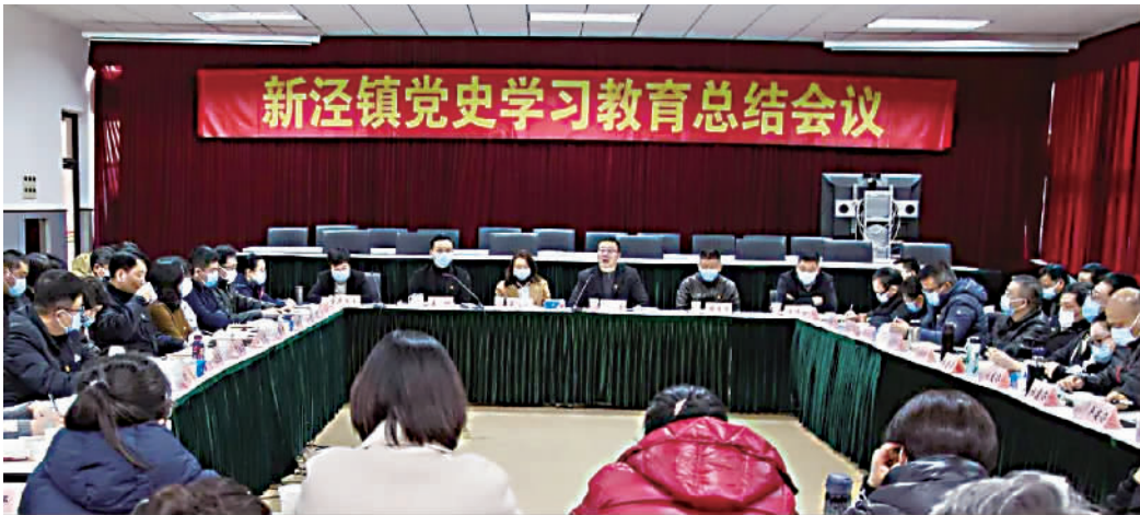
新泾镇党史学习教育总结会

一是加强思想政治建设,进一步筑牢理想信念的堤坝。要把忠诚拥护“两个确立”、坚决做到“两个维护”作为最坚定的政治立场、最牢固的政治信念和最重要的实践要求,贯穿于把握大势大局、推进改