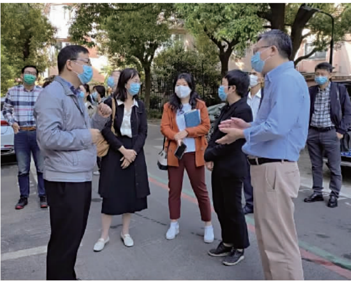
实地调研“七彩同心公益社区”

接下来，新泾镇将继续依托“虹桥国际开放枢纽建设”和“城市数字化转型”两大重要战略机遇，通过政府主导与社会参与相结合、补齐短板与拉长长板相结合、社区更新与慧治赋能相结合、挖掘潜能与盘活存量相结合，构建“一轴串联，双片融合；八水交织，绿脉提升；三核引领，多心联动”的空间格局，聚力谱写“绿色新泾、精品小镇、善治社区、乐活家园”的美丽画卷。