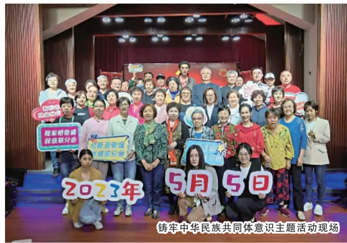
铸牢中华民族共同体意识主题活动现场

接下来,新泾镇民族联将进一步丰富民族团结进步创建工作形式和内涵,持续做好品牌深化,在实践中为品牌增值赋能。