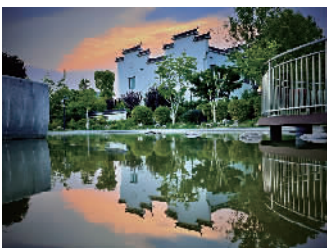
《霞光下的中新泾公园》