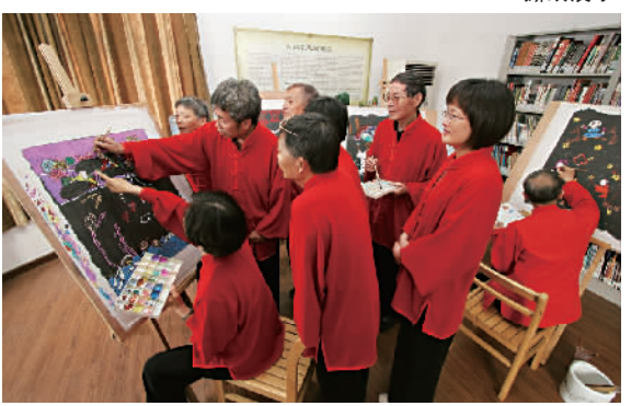
西郊农民画志愿者

索桥旱溪池塘，杉树灌木花草，外加一条“上海最美河道”南渔浦如翡翠项链纵贯而过……经过两年时光的锤炼打磨，养在长宁西隅“深闺”的绿八乐颐生境花园已然成为居民走出家门，亲近自然、拥抱自然的好去处。不满足于将无人问津的“荒废角落”变成现实版的“绿野仙踪”，乐颐生境花园建成后，曾代表长宁区在联合国《生物多样性公约》缔约方大会第15次会议(COP15)上作为展示案例，并成功入选“生物多样性100+全球典范案例”，不仅在昆明生物多样性大会上亮相，还在蒙特利尔第二阶段会议的国际宣传大片中精彩亮相，同年还荣列“上海市家门口的的好去处”榜单。