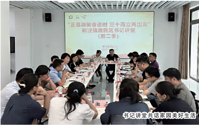
书记讲堂共话家园美好生活