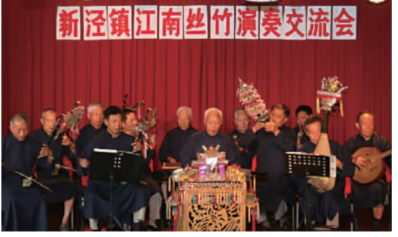
新泾镇江南丝竹演奏交流会