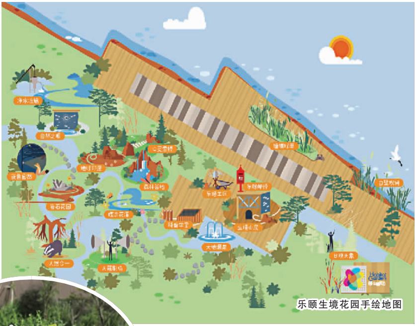
乐颐生境花园手绘地图