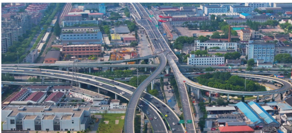
中环军工路立交示意图