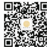
扫描二维码 关注“善治豫园”