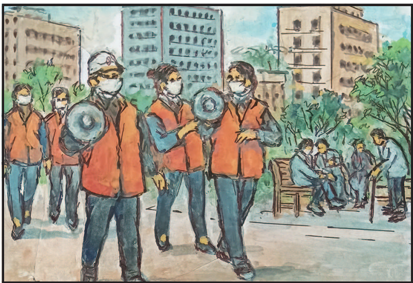
5 安全巡逻不停歇,平安家园齐守护。