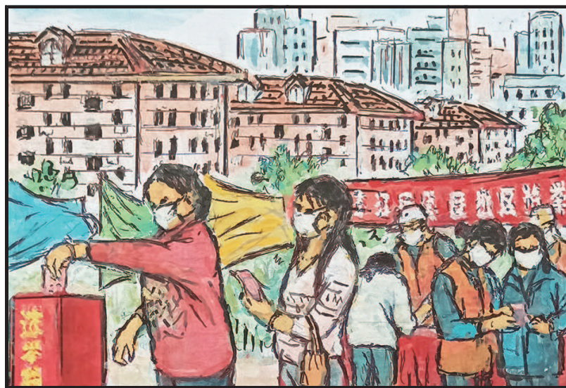
4 戴上口罩来投票,选好社区当家人。