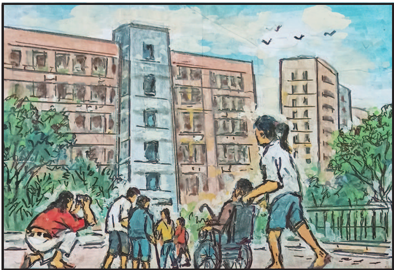
1 光机小区装电梯,居民上下不再难。

近年来,街道上一心,干成了多项“民心工程”,在社区治理上有了创新举措,在垃圾分类工作中有了金点子,在加梯工作中有了新突破,持续用绣花精神为芷江家园绣出蕾丝花边!