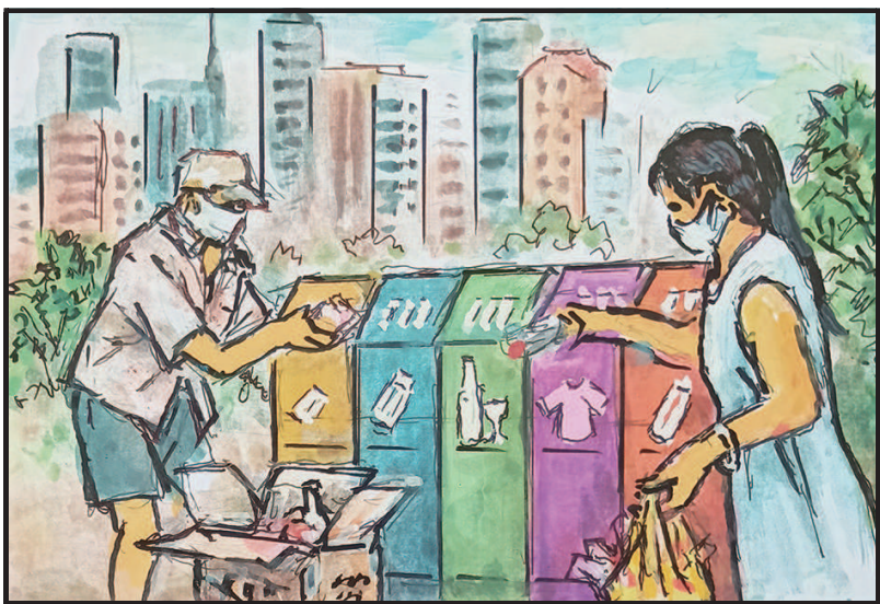
3 垃圾分类有花头,可回收桶1变5。